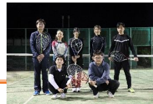
社内サークル（テニス）の様子