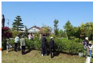
茶摘みイベントの様子