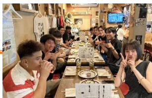
若手社員飲み会の様子