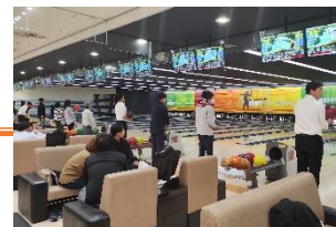
ボウリング大会の様子