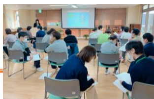
従業員ライフプラン支援講座の様子