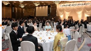
65周年パーティーの様子