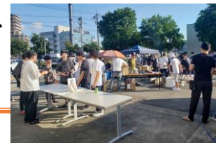
派遣会社とのバーベキューイベントの様子