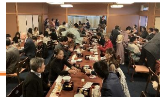
60周年イベントの様子