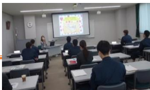
従業員ライフプラン支援講座の様子