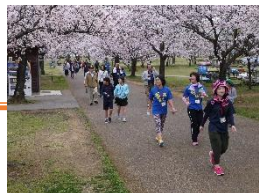
お花見ウォークの様子