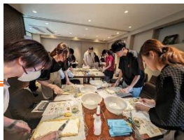
交流セミナーの様子